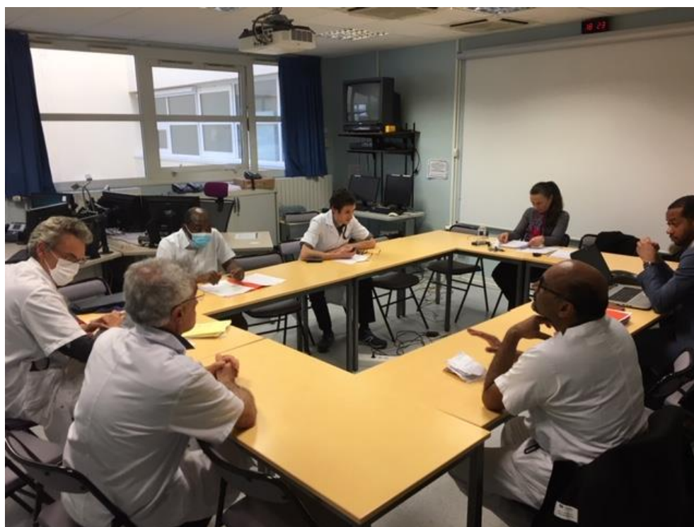
Réunion de la cellule de crise gestion COVID

La « cellule de crise gestion COVID » du CH est composée comme suit :