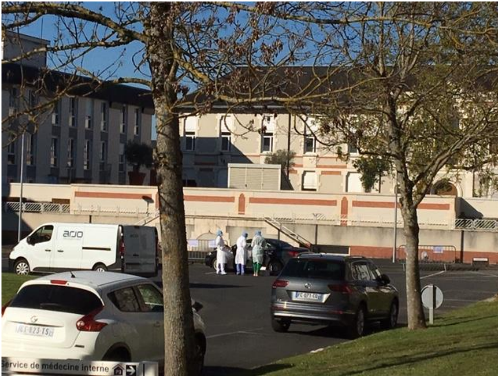
L'unité de prélèvement en extérieur